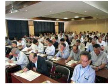
「市町・水土里ネット等 事務責任者会議」を開催しました