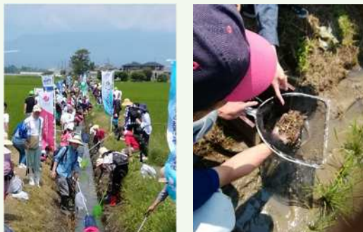
魚のゆりかご水田（生き物観察会）