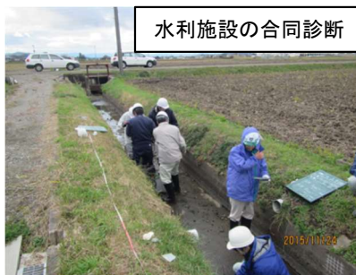
水利施設の合同診断