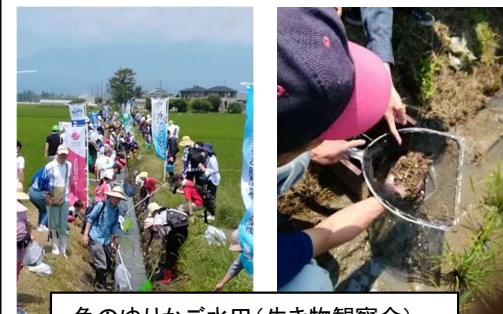
魚のゆりかご水田(生き物観察会)