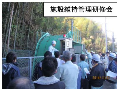
施設維持管理研修会